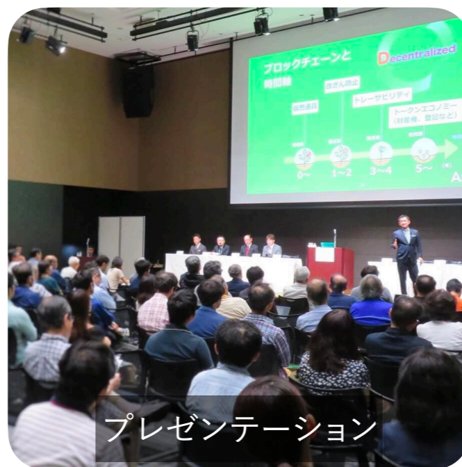
プレゼンテーション