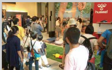
店頭プロモーション