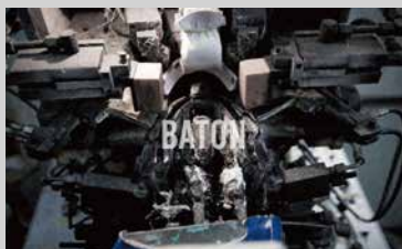
ブランドディレクション